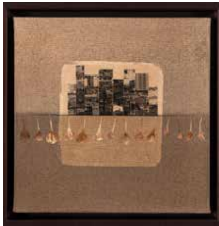
İsimsiz | Untitled, 2018

Tuval üzerine karışık teknik Mixed media on canvas Her biri | Each 30 x 30 cm