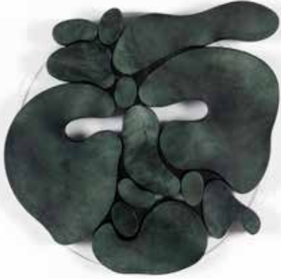
"III. İstif" Serisinden 33 33 From the Series "İstif III", 2018

Pleksi üzerine şasiye gerilmiş boyanmış keçi derisi Painted goat skin mounted on frame on plexiglass Ø 40 cm