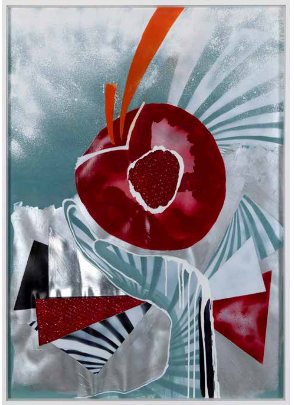
Portreler | Portraits, 2018

Kâğıt üzerine karışık teknik Mixed media on paper Her biri | Each 100 x 70 cm