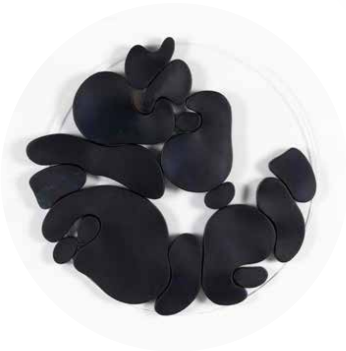
"III. İstif" Serisinden 31 31 From the Series "İstif III", 2018

Pileksi üzerine şasiye gerilmiş boyanmış keçi derisi Painted goat skin mounted on frame on plexiglass Ø 70 cm