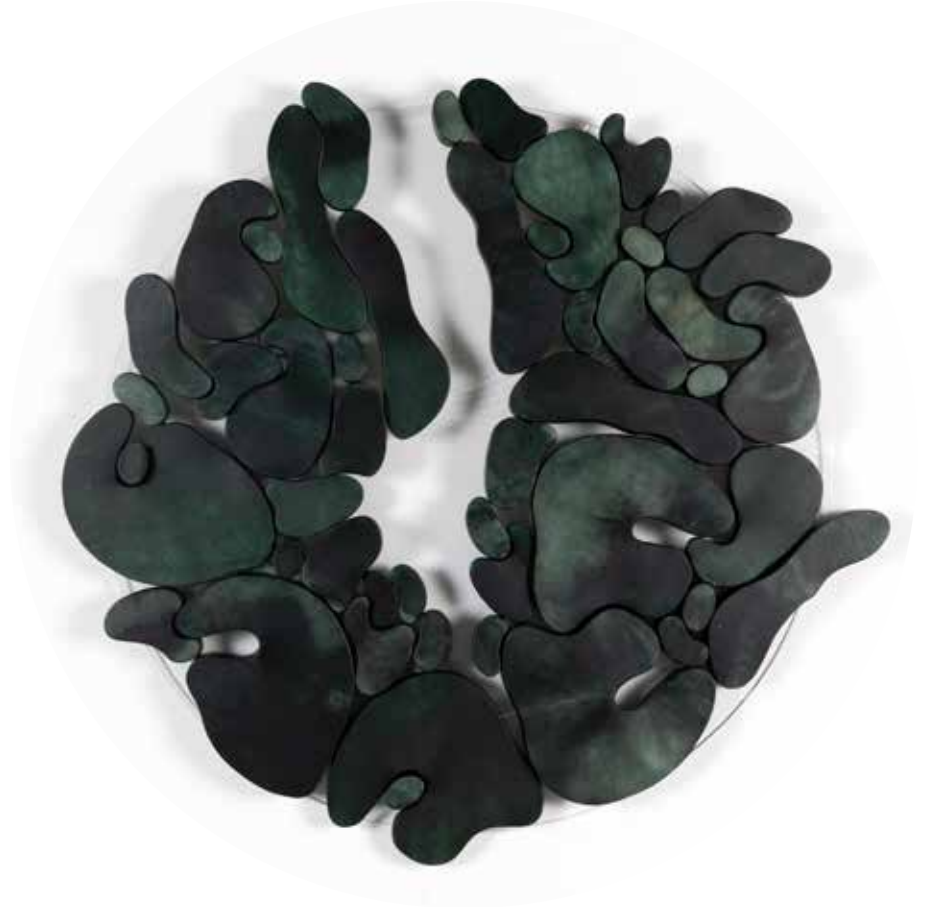
"III. İstif" Serisinden 22 22 From the Series "İstif III", 2018

Pileksi üzerine şasiye gerilmiş, altın varak boyanmış keçi derisi Gold leaf on goat skin and painted goat skin mounted on frame on plexiglass Ø 80 cm