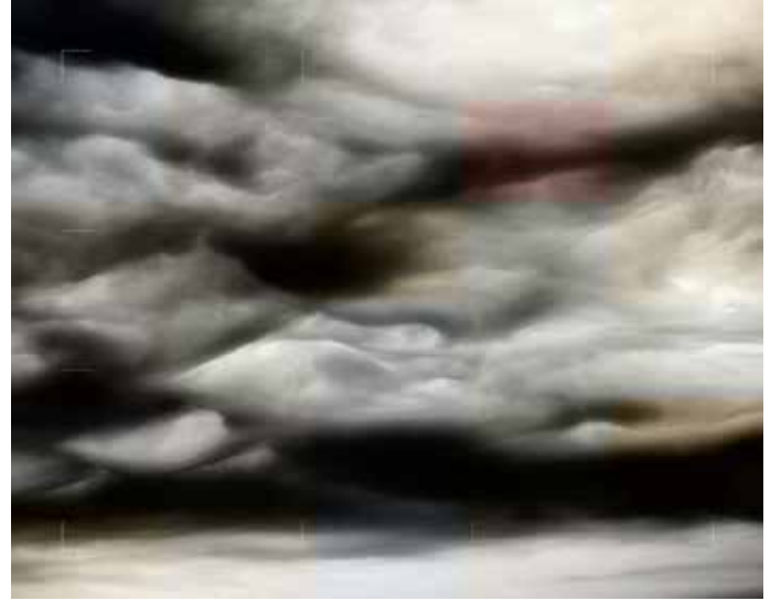
Bulutlar | Clouds III-VI, 2018

Pigment mürekkep baskısı Pigment ink print