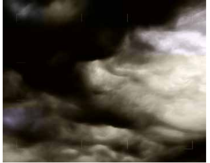
Bulutlar | Clouds VII-X, 2018