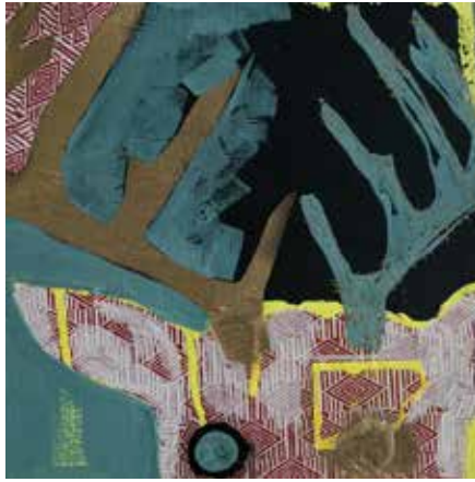
Bir kış gecesi serisi | A winter night series, 2018

Tuval üzerine kâğıt, akrilik, spreyboya Paper, acrylic, spray paint on canvas Her biri | Each 30 x 30 cm