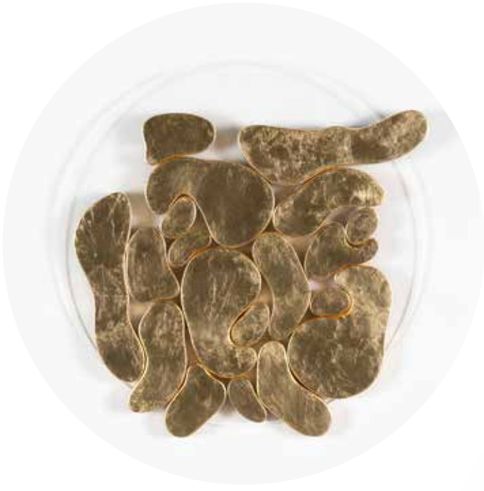
"III. İstif" Serisinden 30 30 From the Series "İstif III", 2018

Pileksi üzerine şasiye gerilmiş, altın varak boyanmış keçi derisi Gold leaf on goat skin and painted goat skin mounted on frame on plexiglass Ø 50 cm