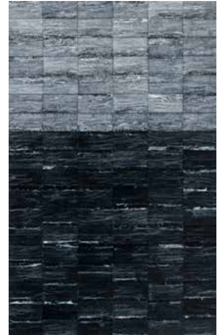
Sepia , 2019

Tuval üzerine karışık teknik Mixed media on canvas Her biri | Each 79 x 47 cm