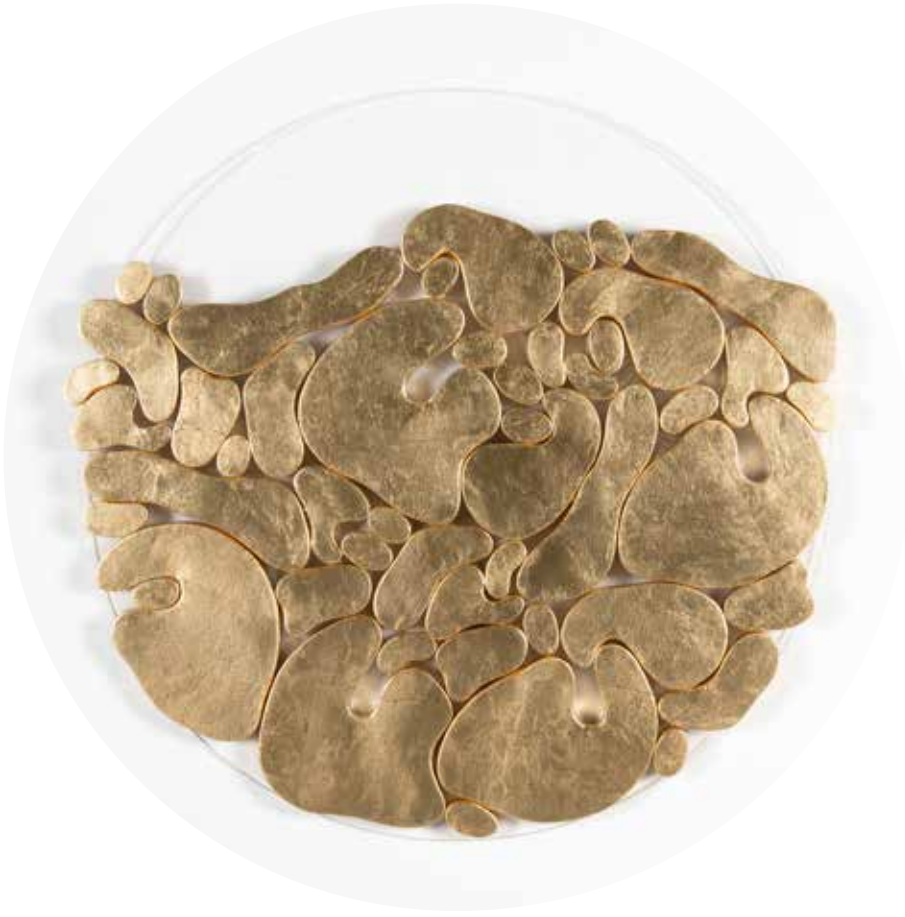
"III. İstif" Serisinden 21 21 From the Series "İstif III", 2018

Pileksi üzerine şasiye gerilmiş, altın varak boyanmış keçi derisi Gold leaf on goat skin and painted goat skin mounted on frame on plexiglass Ø 80 cm