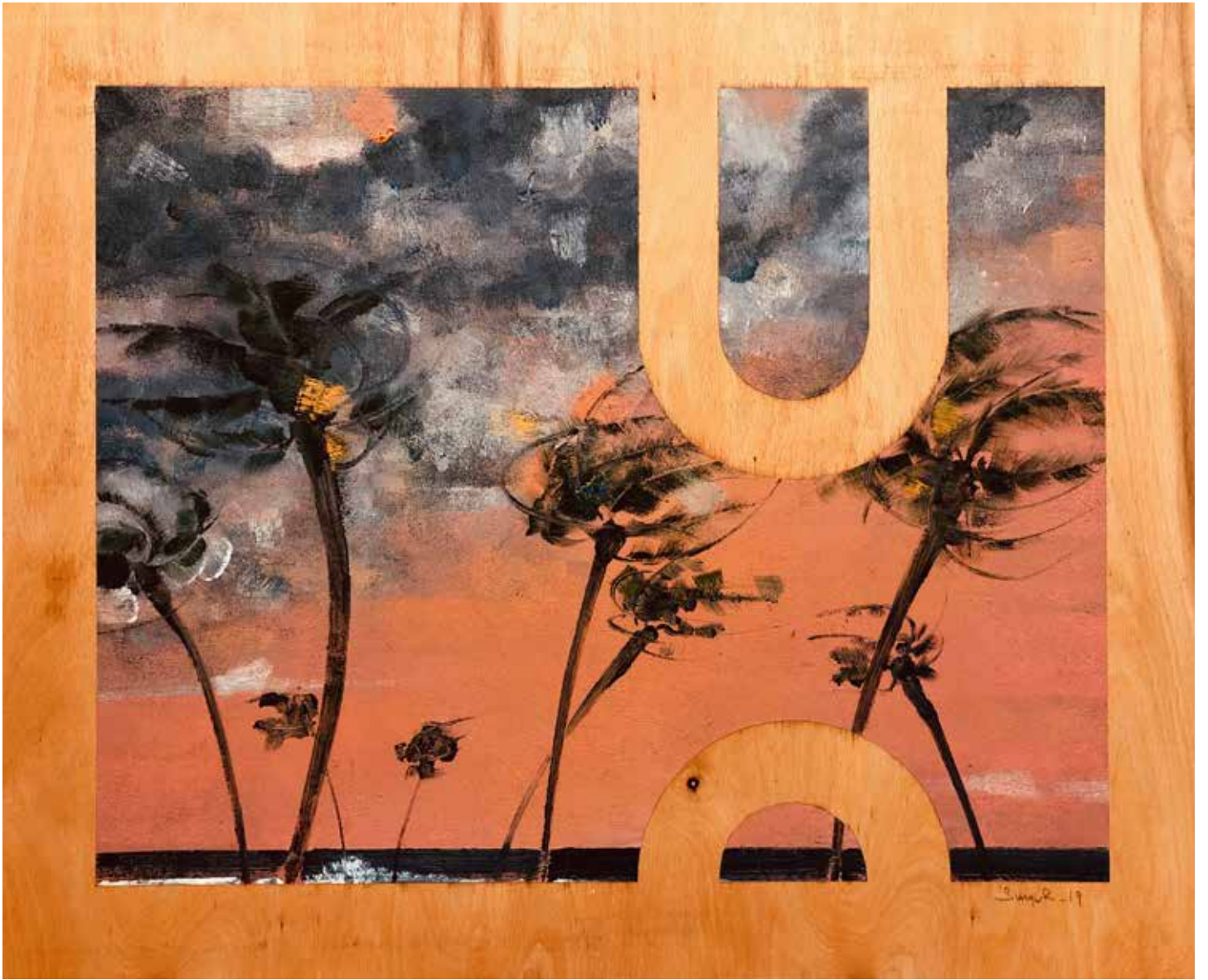
İsimsiz | Untitled, 2019

Kontrplak üzerine yağlı boya Oil on plywood Her biri | Each 70 x 85 cm