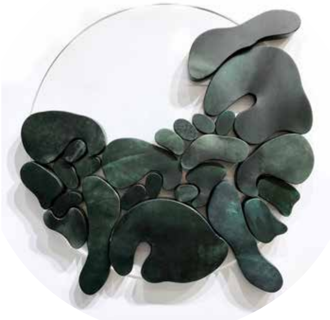
"III. İstif" Serisinden 29 29 From the Series "İstif III", 2018

Pleksi üzerine şasiye gerilmiş naturel keçi derisi Natural goat skin mounted on frame on plexiglass Ø 40 cm