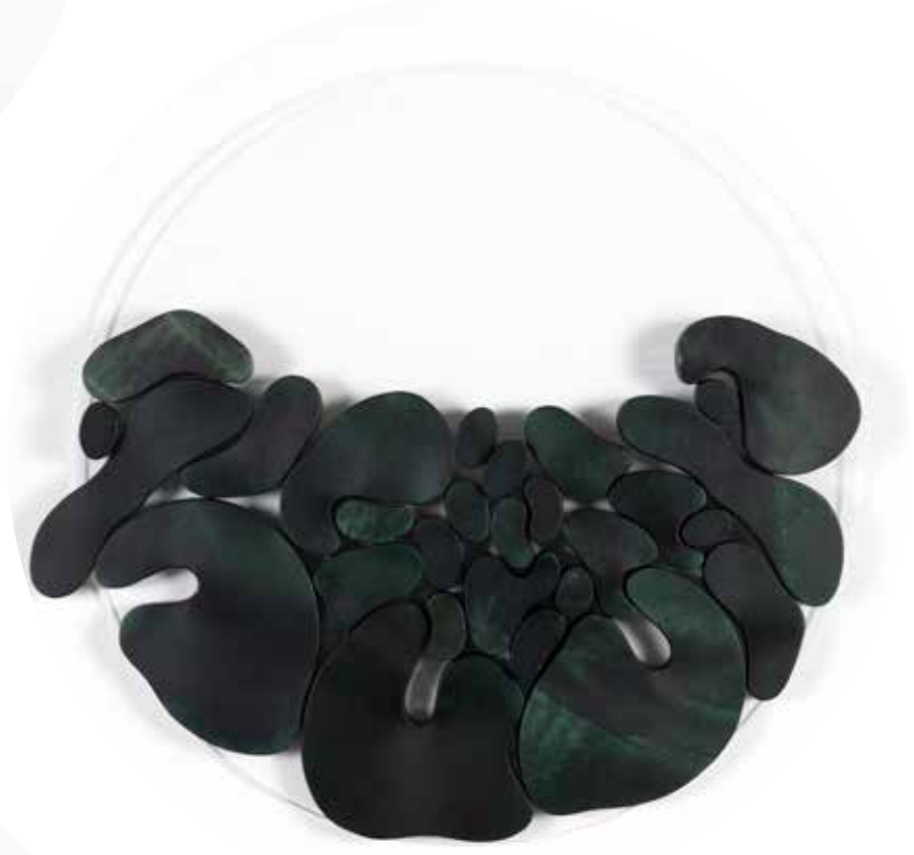
"III. İstif" Serisinden 24 24 From the Series "İstif III", 2018

Pileksi üzerine şasiye gerilmiş, altın varak boyanmış keçi derisi Gold leaf on goat skin and painted goat skin mounted on frame on plexiglass Ø 50 cm