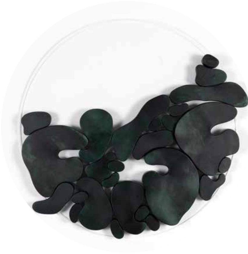
"III. İstif" Serisinden 25 25 From the Series "İstif III", 2018

Pleksi üzerine şasiye gerilmiş boyanmış keçi derisi Painted goat skin mounted on frame on plexiglass Ø 70 cm