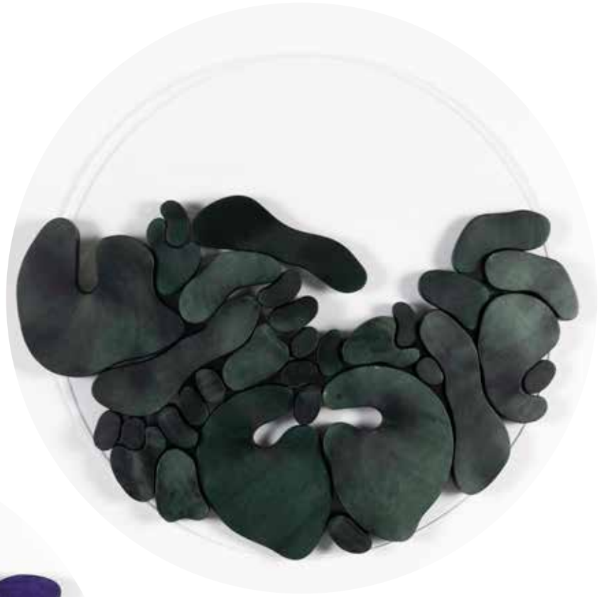
"III. İstif" Serisinden 28 28 From the Series "İstif III", 2018

Pleksi üzerine şasiye gerilmiş boyanmış keçi derisi Painted goat skin mounted on frame on plexiglass Ø 70 cm