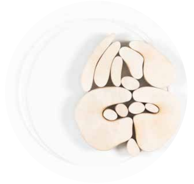
"III. İstif" Serisinden 34 33 From the Series "İstif III", 2018

Pleksi üzerine şasiye gerilmiş boyanmış keçi derisi Painted goat skin mounted on frame on plexiglass Ø 70 cm