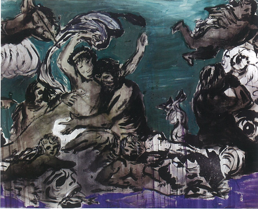
Bedri BAYKAM, Galatee (Detay), tuval üzeri karışık teknik, 201x247 cm

Bedri Baykam, gözlem ve algı sınırlarının gücünü belirleyen tespitlerin kompozisyonlarının ressamıdır. 1960'ların dünyasının nesnel gerçekçilerinin doğrularını ve dünyayı eleştiren düşüncelerini günümüze kadar kendi üslubuyla geliştirerek getirir. Konular, olaylar ve tepkiler üçgeninde rahat, özgür ve başkaldıran kompozisyonlar kurar. Malzemede sınır tanımayan uygulamalar, güncel konulardan sanatın tarihinin içinde var olan sanatçılara, siyasi tarihin döngüleri olan olaylara ve kahramanlara kadar uzanan çeşitlilik içinde, özgür kompozisyonlarını kurar.